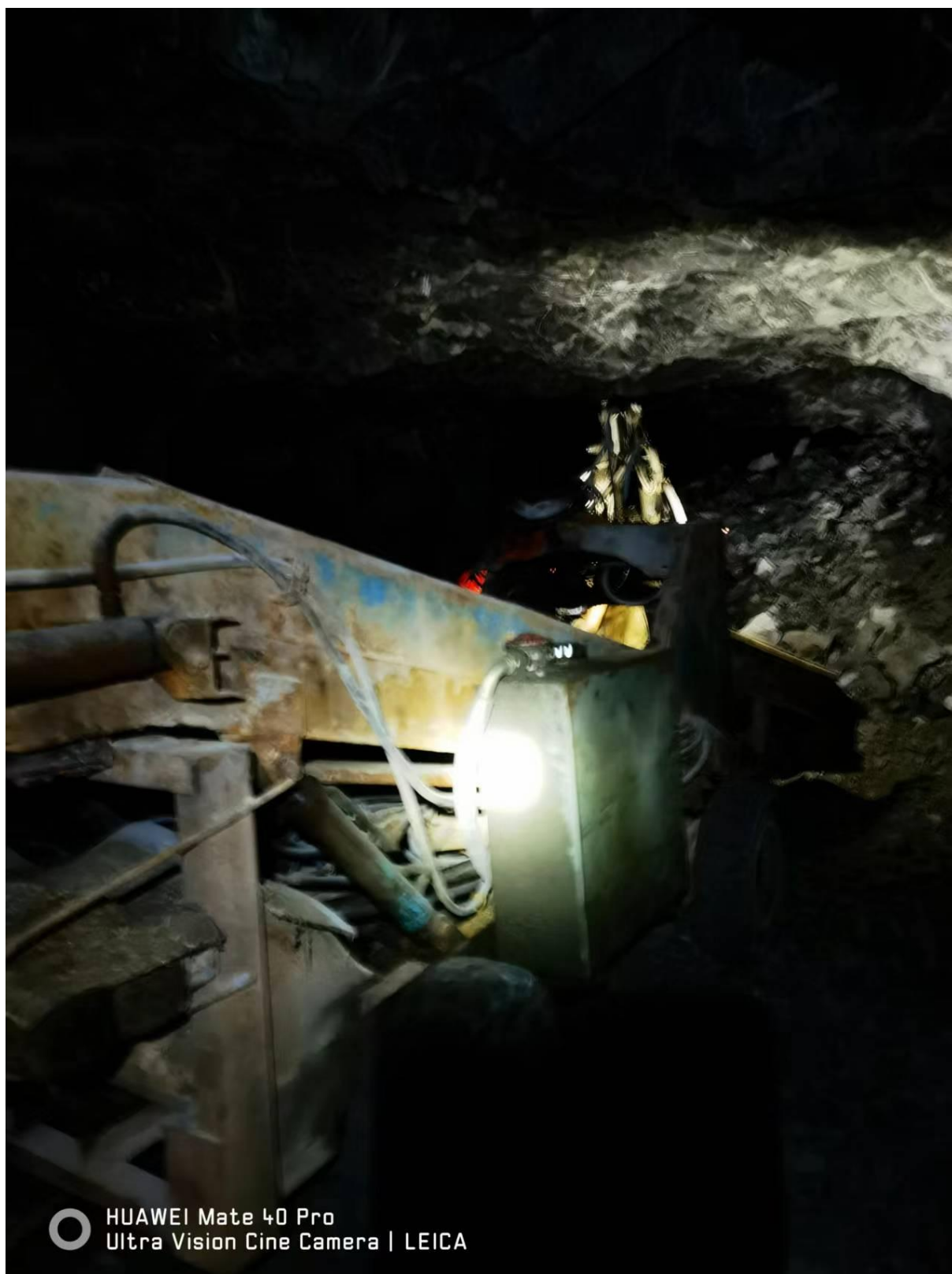
矿山井下出渣工具（矿用挖掘式装载机）